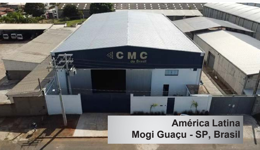
América Latina Mogi Guaçu - SP, Brasil

A Divisão de Equipamentos projeta e fabrica equipamentos para atender suas necessidades específicas. Nossa equipe de engenheiros e técnicos cuidam para produzir um equipamento durável, eficiente e adequado ao seu processo.