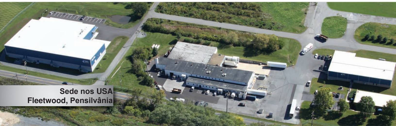
Sede nos USA Fleetwood, Pensilvânia

Custom Milling & Consulting, Inc. é a solução completa para todas as suas necessidades de processamento de materiais úmidos. Na sede, em Fleetwood, Pensilvânia, são fabricados equipamentos e oferecidos serviços de moagem e fabricação por contrato. Em São Paulo, a CMC do Brasil , representante para a América Latina, pode oferecer os mesmos serviços de moagem e testes em escala piloto em suas instalações.